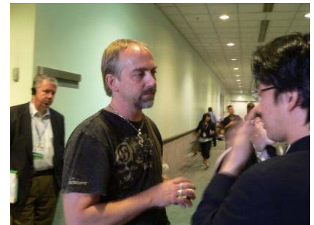
Richard Garriott, mieux connu sous le pseudo de Lord British

se trouve le génie d'un pionnier du jeu vidéo, Richard Garriott, mieux connu dans le milieu sous le nom de Lord British (car il est né en Angleterre).