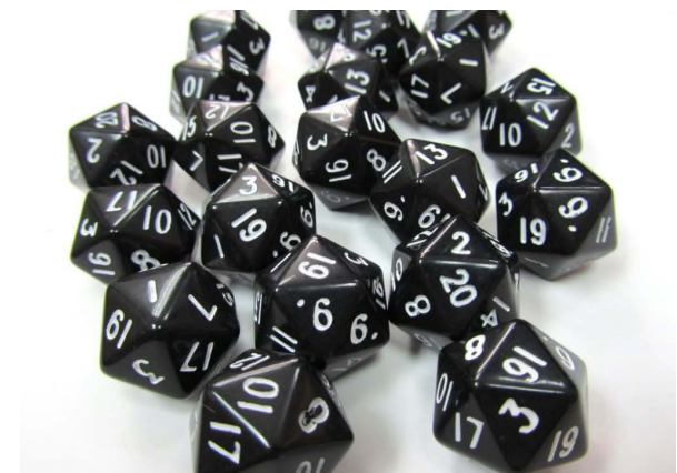
En haut, une session de RPG sur table dans la série IT Crowd. Ci-dessus, quelques dés exotiques utilisés dans ces parties...