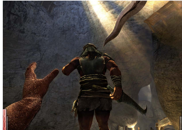
Le très dynamique Dark Messiah d'Arkane

hender le jeu à sa façon, sans dicter une vision unique du game designer. C'est une philosophie qui fut reprise dans un genre différent par Arkane dans Dark Messiah en 2006, un RPG-FPF (First Person Fighter ?) atypique qui proposait des environnements très flexibles et interactifs pour donner vie aux combats et les rendre bien plus dynamiques par rapport à d'autres jeux qui ne demandaient qu'à aligner une simple combinaison de boutons. Le style pourrait se définir comme un mélange d'éléments de RPG, en vue immersive, et aux possibilités multiples pour résoudre un problème.