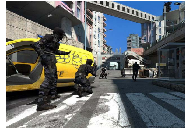
The Crossing, un projet en suspens...